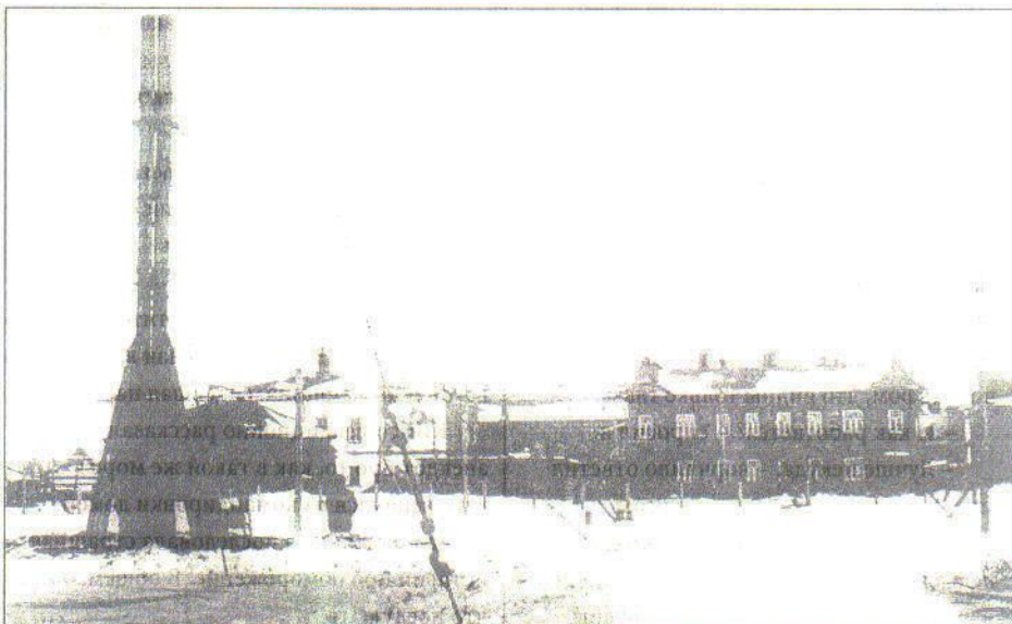
Эта радиомачта служила А. Колчаку.

фрагмент радиовышки омской радиостанции РВ-94 (справа)